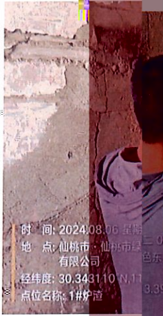
附图 2: 现场监